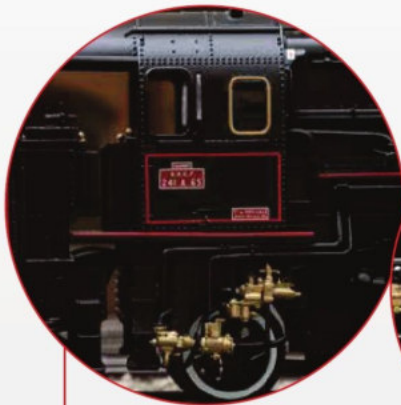
Auch auf den zweiten Blick... Schönheit mit vielen goldfarbenen Details Also at Second Glance... Beauty with many gold-colored details

The massive class 241 A steam locomotives appeared on French rails at the start of the Thirties. In the "golden" era of travel before World War II, they pulled heavy express trains between Paris and the Atlantic ports of Cherbourg and Le Havre as well as between Paris and Basle. There the famous Arlberg Orient Express was part of their tasks. After the end of the war, they ran until 1965 mainly between Paris and Strasbourg as well as Paris and Basle. Road number 241 A 1 in the Mulhouse Railroad Museum as well as road number 241 A 65 in Switzerland remain preserved, the latter as the largest operational steam locomotive in Europe.