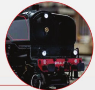
Eine Lok wie ihre Zeit... Gigantische Schönheit A Locomotive like Its Era... Gigantic Beauty

This model can be found in a DC version in the Trix H0 assortment under item number 22941.